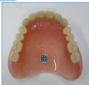
上顎の ID デンチャー