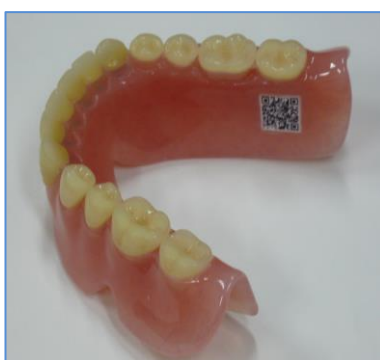
下顎の ID デンチャー