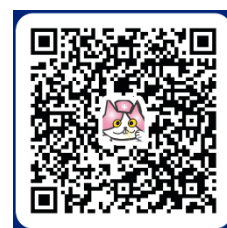
登録申請二次元コード