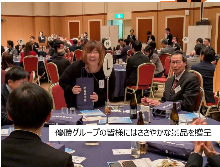
優勝グループの皆様にはささやかな景品を贈呈